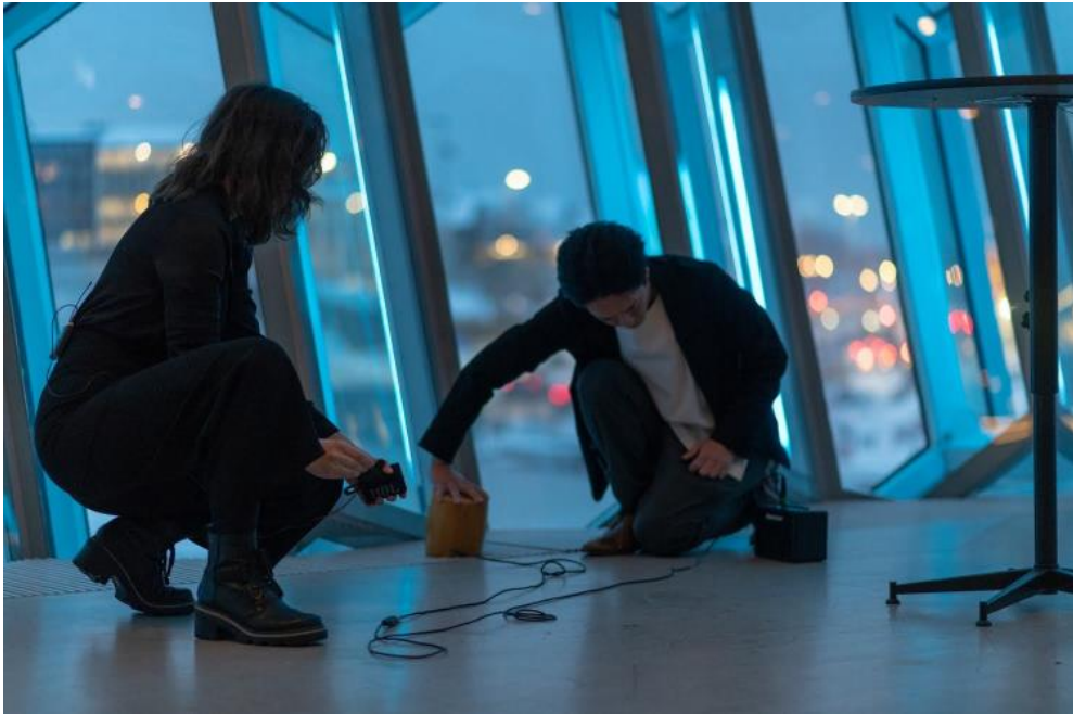
Mynd 5: Af tónleikum Skerplu á Myrkum músíkdögum þar sem flutt voru verk eftir Pauline Oliveros.