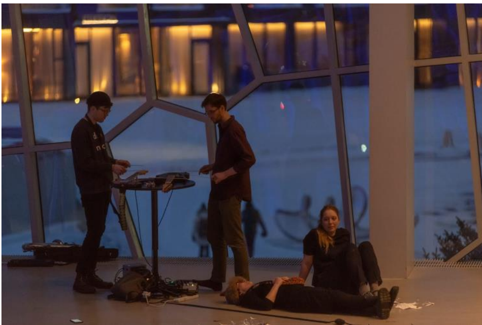
Mynd 3: Af tónleikum Skerplu á Myrkum músíkdögum þar sem flutt voru verk eftir Pauline Oliveros.