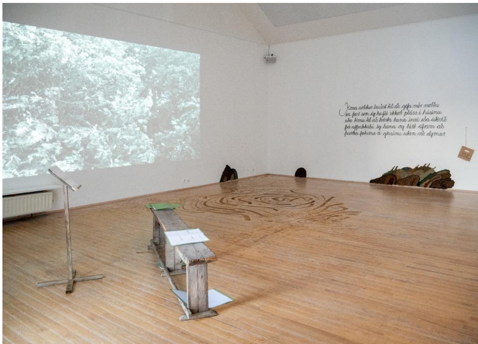
Mynd 1: Innsetningin Draumur Thoreau . Það er eins og gengið sé inn á æfingu þar sem flytjendurnir virðast hafa brugðið sér frá. Tilviljunarkennt gagg og vængjasláttur úr hátölurum gefur til kynna að þeir séu ekki langt undan. (© Kristín Þóra Guðbjartsdóttir).

Þær hugmyndir Ara Benjamin Meyers sem höfðu hvað mest áhrif á framsetningu á verksins eru: