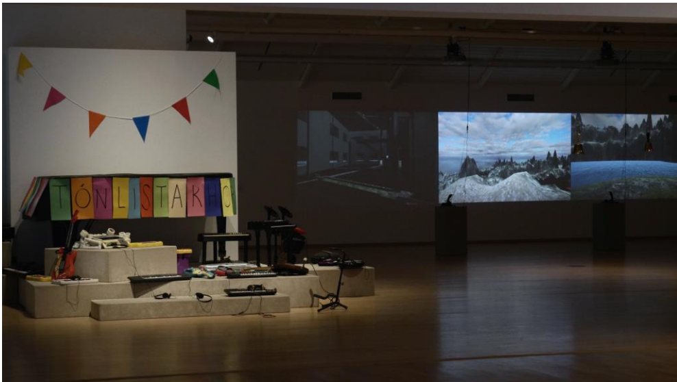
Mynd 5: Tónlistarhornið (2019) eftir Curver Thoroddsen (til vinstri) og Kilgore's Resort (2019) eftir Marko Ciciliani

Í tölvuleik Steinunnar Eldflaugar, OUR ATLANTIS (ノ●ヲ●) / THE GAME (2018), safna iðkendur leiksins hljóðbútum úr samnefndu lagi Steinunnar, á víð og dreif innan heims leiksins, sem þakinn er myndum og myndmáli sem fylgt hefur tónlist Steinunnar alla tíð, sem órjúfanlegur hluti af henni. Útgáfa leiksins ber vott um nýstárlega leið tónlistarútgáfu í samtímanum, jafnframt því að vera fullkominn samruni þess mynd- og tónheims og leikgleði sem einkennir list Steinunnar.