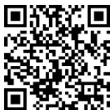
Myndband 1: Stikla sýningarinnar Hljóðönn – sýning tónlistar 1

Í fyrri hluta greinarinnar verður lauslega farið yfir þróunarferli sýningarinnar og tildrög hennar frá sjónarhóli sýningarstjóra. En í seinni hluta hennar er að finna texta úr sýningarskránni, sem ætlaður var að veita sýningargestum innsýn í sjónarhorn sýningarinnar á þetta víðfedma viðfang sýningarinnar; tónlist.