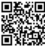
Myndband 3: Violin Power eftir Steinu 14

Áður en Steina sneri sér alfarið að myndbandsmiðlinum og myndlistinni hóf hún sinn feril sem fiðluleikari og hefur fiðlan verið áberandi í verkum hennar allan hennar listamannsferil. Í myndbandsverkinu, Violin Power (1978), fléttast saman ólík myndskleið frá árunum 1969-78, þar sem Steina leikur á fiðluna, að einum þræði nokkurs konar portrett af listamanninum, en einnig leikur Steina hér fyrir myndbandsmiðilinn og á hann, ef svo mætti segja. Í verkinu hefur fiðluleikur Steinu áhrif á það hvernig myndin bjagast í rauntíma. Hér teiknar Steina í myndbandsmiðilinn með fiðlunni. Tónlistin verður sem afleiða þessarar teikningar í myndbandsmiðilinn.