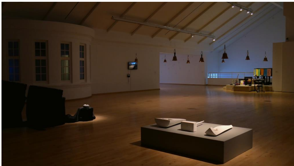
Mynd 2: Sýningin í Hafnarborg

Sýningunni er ætlað að hlera ólík samtöl á milli efnisheimsins og tónlistarinnar, þar sem hlustunin og upplifun tónlistarinnar er sterklega lituð tónum efnisheimsins. Hér eru sýnd verk þar sem sjónrænn þáttur verkanna spilar stórt hlutverk í heildarupplifun hvers verks, skapar tónlistinni annað samhengi og tilvísanaheim og hlustunin er lituð af sjónrænni upplifun. Hér hefur tilvísanaheimur hlutarins áhrif á samband okkar við hljóðin sjálf og tónlistarlega hlustun. Í hlutunum sjálfum er að finna mörk tónlistarinnar, hvernig hún verður til og vindur fram. Ætlunin er að nálgast hljóðin á sem fjölbreytilegastan máta, sem tónlist, sem skúlptúr, sem rými og sem myndflöt. Leyfa efnisheimi tónlistarinnar að leiða okkur áfram í upplifuninni og bæta enn frekar í þessa skynjunarsögu mannsins.