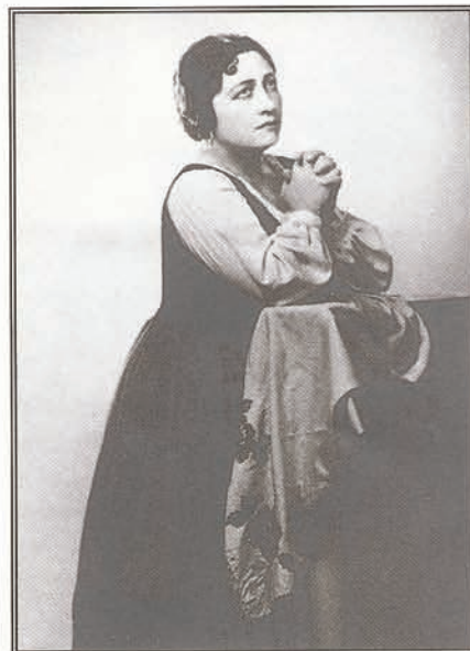
Ebe Stignani sem Santuzza í óperu Mascagnis, Cavalleria rusticana .

Karin Branzell (1891–1974) var önnur af tveim sænskum kontraaltsöngkonum, sem vöktu heimsathygli, þótt nöfn þeirra séu farin að gleymast nú. Karin Branzell var sú sem var fyrr á ferðinni og var sérlega dád fyrir óvenju fagaða og fagra rödd. Hún byrjaði feril sinn sem organisti í Stokkhólmi, þar sem hún var fædd, en lagði síðan stund á söngnám í