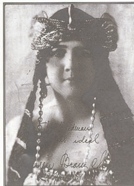
Karin Branzell í hlutverki Amneris í Aidu eftir Verdi.

fæðingarborg sinni, Berlín og loks í New York. Hún kom fyrst fram í Stokkhólmi árið 1912 og söng við Stokkhólmsóperuna til ársins 1918. Þá réði hún sig að Ríkisóperunni í Berlín og var einn af máttarstóplum hennar til ársins 1933. En árið 1924 kom hún fyrst fram á Metropolitan óperunni í New York, en söng sína seinustu sýningu þar árið 1944. Hún kom fram á Wagnerhátíðinni í Bayreuth 1930–31 og söng við flest meiri háttar óperuhús í Evrópu, Banda-