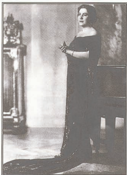
Sigríð Onegin í óperu Strauss, Ariadne auf Naxos .

Sigríð Onegin (1889-1943) var á sínum tíma ein af þekktustu kontraaltsöngkonum heims. Hún var einstök á sínu sviði og ólík flestum öðrum kontraalt söngkonum að því leyti til, að röddin var alveg óvenjulega litrík. Grunnlit raddarinnar var oft líkt við portvín, en í gegn skinu ljósir og dökkir litir allt eftir því, hvað átti við viðfangsefnið, sem hún var að fást við. Hún var auk þess ein af fáum kontraalt söngkonum síns tíma sem hafði fullt vald á flúrsöng og lét það jafnvel og að syngja þyngstu hlutverk í Verdi og Wagneróperum.