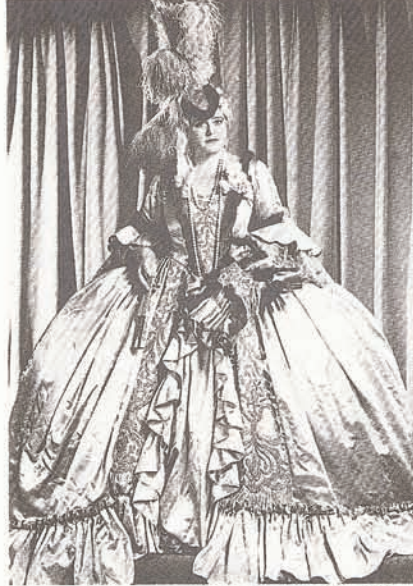
Lotte Lehmann sem Die Marschallin í Der Rosenkavalier .